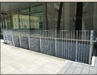
Kaupungintaloa ympäröivä kaidemalli. Muotoiltu teräslatta, RAL 9006. Käsitönd: Harjattu RST-putki.