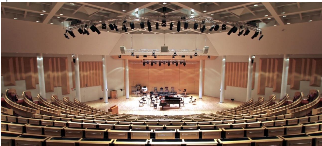
kuva 1: Lappeenranta-sali