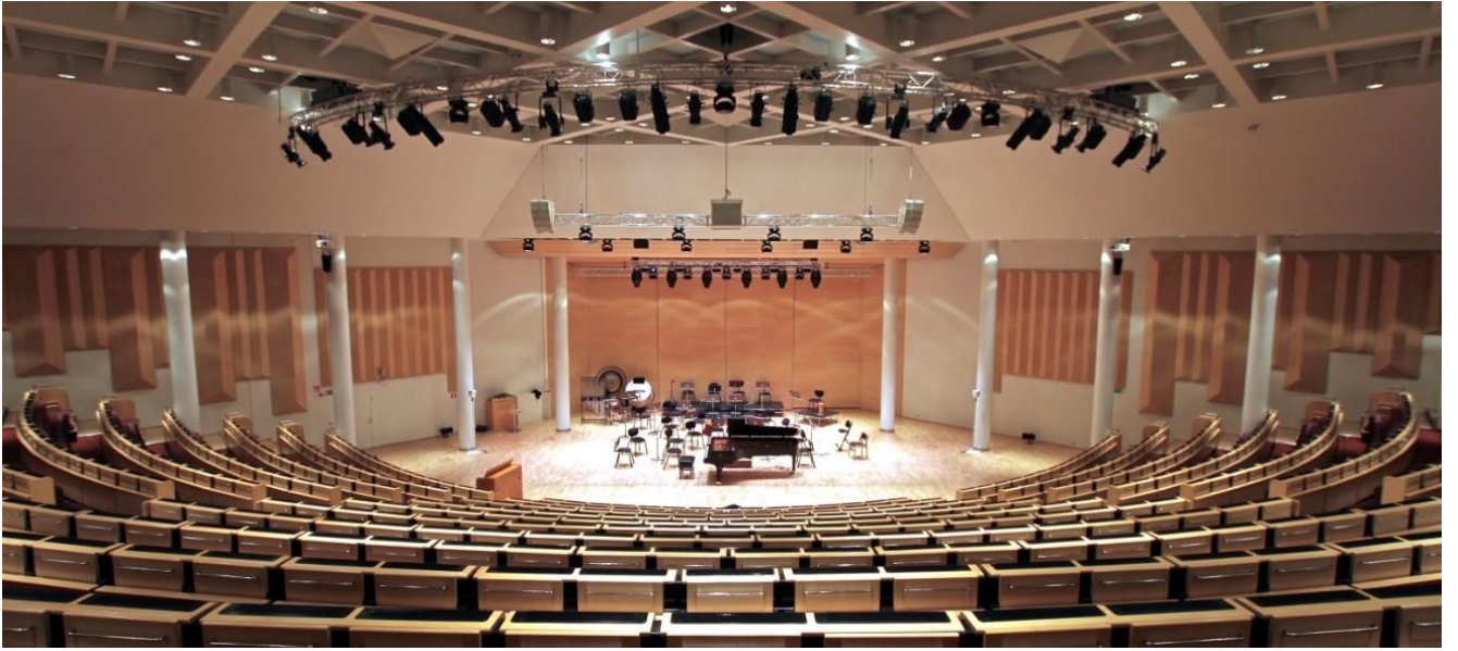
kuva 1: Lappeenranta-sali